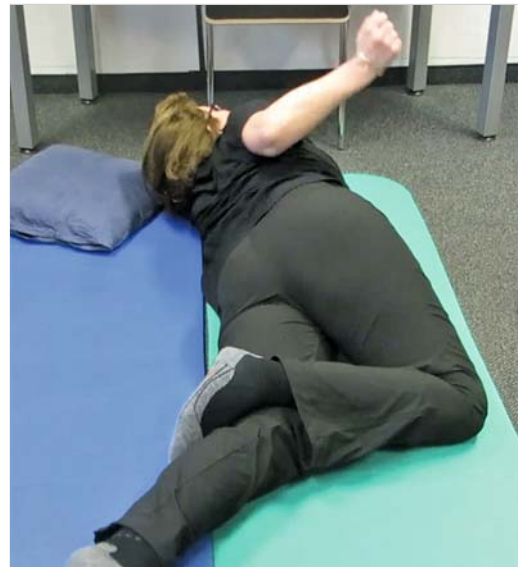
Abb. 2.8 Die Patientin nutzt weiterhin die konzentrische Funktion ihrer Extensorensynergie, um sich zu stabilisieren. Hierdurch kompensiert sie die mangelnde exzentrische Funktion dieser Synergie.