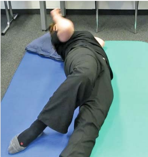
Abb. 2.5 Eine Patientin Mitte 50 mit Multipler Sklerose kann sich mangels konzentrischer Funktion der ventralen Rumpfflexoren nur mit viel Kompensation auf die Seite abdrücken. Hierfür nutzt sie ihre bessere dorsale Muskulatur in konzentrischer Funktion.