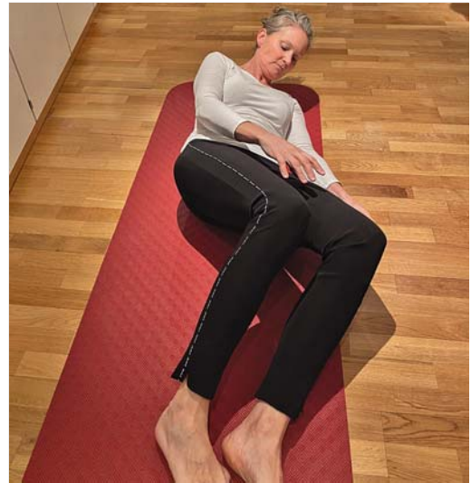
Abb. 2.6 Das Drehen aus der Rückenlage auf die linke Seite wird mit Augen- und Kopfbewegungen eingeleitet. Der rechte Arm überquert die Körpermitte (Augen-Hand-Koordination). Das untenliegende Bein flektiert mit Abduktion und Innenrotation, gefolgt von der Flexion mit Adduktion und Außenrotation des obenliegenden Beines.