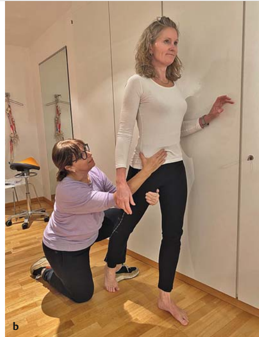
Abb. 2.3 Patientin mit eingeschränkter Hüftextension.