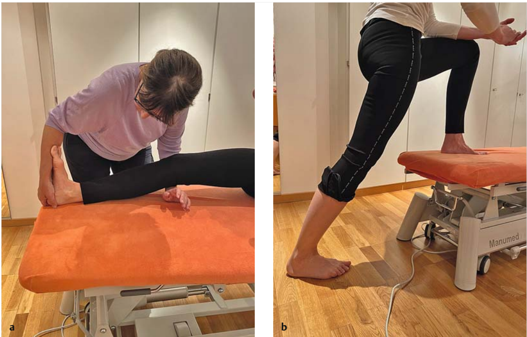
Abb. 2.2 Eine Patientin nach Bandscheibenvorfall L5/S1 hat eine Fußheberschwäche. Die Therapeutin möchte die Dorsalextensionsbeweglichkeit ihres oberen Sprunggelenks evaluieren.