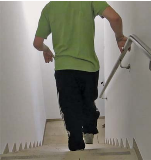
Abb. 2.4 Ein 23-jähriger Patient mit der Diagnose ICP ist nach 5 Tagen Therapie in der Lage, eine Treppe mit Handlauf flüssig alternierend hinauf- und herabzusteigen. Zuvor war dies nur im Nachstellschritt mit viel Hilfe seiner Arme möglich.