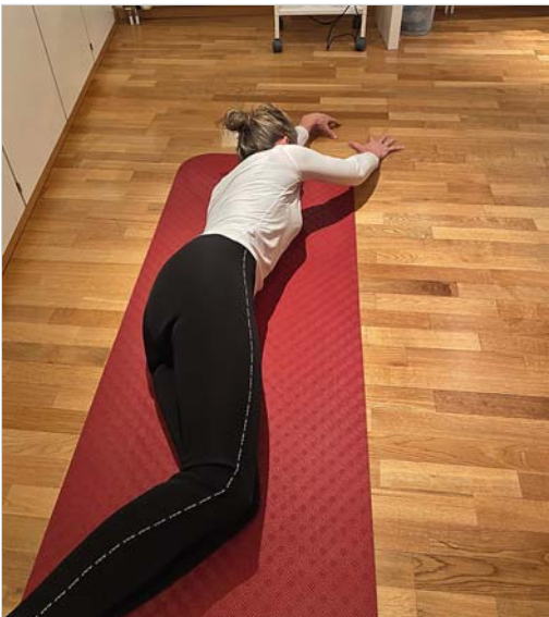
Abb. 2.7 Das Drehen aus der Seitenlage in die Bauchlage wird ebenfalls mit den Augen und dem Kopf eingeleitet. Der oberliegende Arm streckt nach oben. Hierbei arbeiten die dorsalen Rumpfmuskeln exzentrisch.