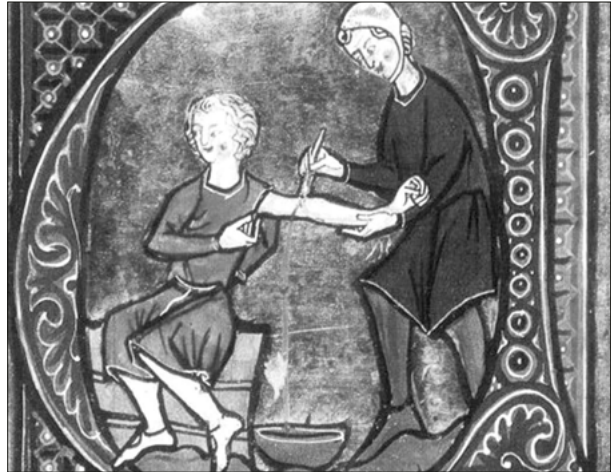
Abb. 1.2 Obgleich die Ursprünge der Placebo-Behandlung weit zurückliegen, wurde der Placeboeffekt erst Mitte des 20. Jahrhunderts zum Gegenstand der Forschung.