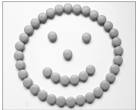
Abb. 1.1 Ob Linderung von Schmerzen, Reduktion von Schwellungen, Gelenkentzündungen, Übelkeit oder Magengeschwüren – die Forschungsarbeiten der letzten 60 Jahre zeugen von vielfältigen Placeboeffekten.