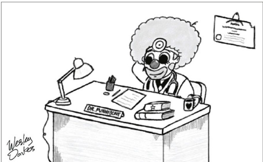
Abb. 2.16 Mit Humor die Arzt-Patienten-Beziehung und den Gesundheitszustand verbessern.

Die Vorzüge des Humors in Bezug auf die Gesundheit wurden 1979 mit der Veröffentlichung von Norman Cousins' Buch Anatomy of an Illness [118] publik gemacht. Darin beschrieb er, wie Lachen und Vitamin C seine Genesung bei Morbus Bechterew unterstützten. Laut Cousins führten 10 Minuten Lachen zu 2 Stunden schmerzfremem Schlaf und einer Verringerung der Blutsenkungsreaktion. Etwa zur gleichen Zeit verwendete Patch Adams Humor als integralen Bestandteil seiner Vorgehensweise als Arzt. Er gründete das „The Gesundheit! Institute“ im Jahr 1971, aber erst 1998, als der Film über sein Leben herauskam, wurde es bekannt. Vielleicht kennt der eine oder andere ihn und seinen Einsatz von Humor, aber in Wirklichkeit ist Patch Adams und seine Herangehensweise tatsächlich so viel mehr. Zu sagen, dass Patch Adams in seiner Herangehensweise Humor verwendet, ist wie zu sagen, dass ein Auto Zündkerzen benötigt.