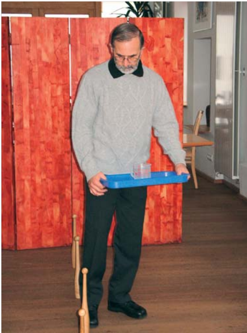
Abb. 6.12 Dual Task.

lässt sich erkennen, dass besser direkt mit den Patienten auf dem Laufband mit Gewichtsentlastungssystem das Gehen ausprobiert werden sollte, falls das Üben des Transfers nicht funktioniert. Mit diesem Vorgehen können oft mithilfe des Gehens das Stehen und die Transfers beeinflusst und verbessert werden. Im Vergleich zum Gangmuster sind nämlich die motorischen Programme für das Stehen und das Umsetzen nicht so tief verankert und deswegen nicht immer leicht abrufbar.