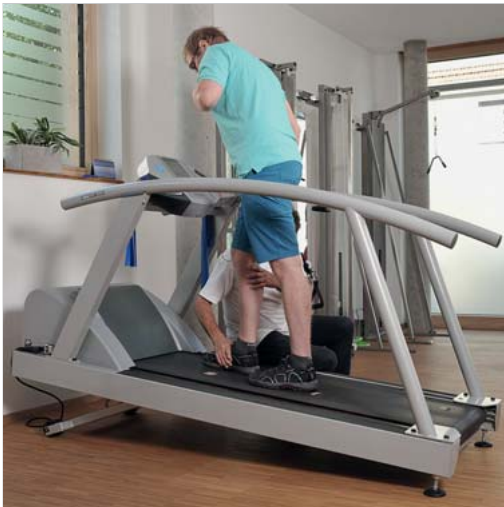
Abb. 6.15 Laufband mit Steigung.