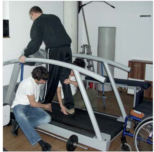
Abb. 6.11 Passives Vorsetzen der Füße auf dem Laufband.

zeugen können (MacKay-Lyons 2002): Bewegungen, wie z. B. Laufen, Rennen, Fliegen, Schwimmen, Kaubewegungen, Atmung, werden durch diese neuronalen Netzwerke im ZNS erzeugt und durch sensorische Rückkopplung den Umweltefordernissen angepasst. Auch wenn Gehen eine Willkürhandlung ist, so muss es dennoch nur willkürlich in Gang gesetzt werden und läuft dann selbstständig automatisiert weiter: wir müssen nicht daran denken, wie wir gehen, da das Gehen von diesen spinalen Schaltkreisen kontrolliert wird (Dietz