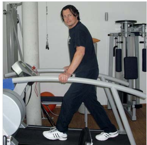
Abb. 6.1 Laufbandtraining.

Inzwischen haben zahlreiche Studien dazu geführt, dass das Laufbandtraining aus dem Lokomotionstraining besonders bei Querschnittpatienten und Halbseitengelähmten nach Schlaganfall nicht mehr wegzudenken ist (Hesse et al. 1994, ▶ Abb. 6.1). Auch erste Untersuchungen bei Parkinson- und MS-Patienten (Laufens et al. 1999) zeigen in vielen Parametern eine größere Verbesserung als beim Gangtraining ohne die Benutzung eines Laufbands. Ein partielles Gewichtsentlastungssystem (BWS) mit Hilfe von Fallschirmgurten bzw. speziell entwickelten Haltegurten, ermöglicht es auch schwerstbetroffenen Patienten in der Frühphase der Rehabilitation von einem Laufbandtraining zu profitieren (▶ Abb. 6.2).