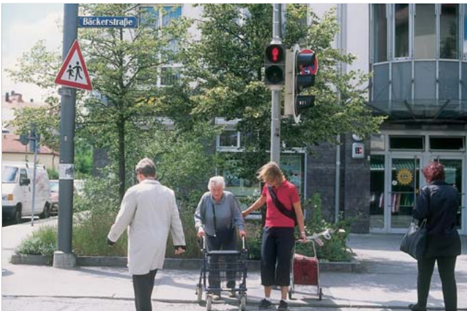
Abb. 6.14 Fußgänger an Ampel.

Verkehrsteilnehmern deutlich als zu lang empfunden werden [...]“ (Richtlinien für Lichtsignalanlagen, RiLSA 2010, ► Abb. 6.14). Diese Regelung erschwert für viele neurologische Patienten, aber auch für viele andere Mitbürger, die nicht mehr so schnell gehen können, die Möglichkeiten zur Teilhabe am sozialen Leben, wie es im ICF festgeschrieben ist. Für viele Patienten ist diese Anforderung ein so großes Hindernis, dass sie die Wohnung nicht mehr verlassen und kaum noch soziale Kontakte pflegen.