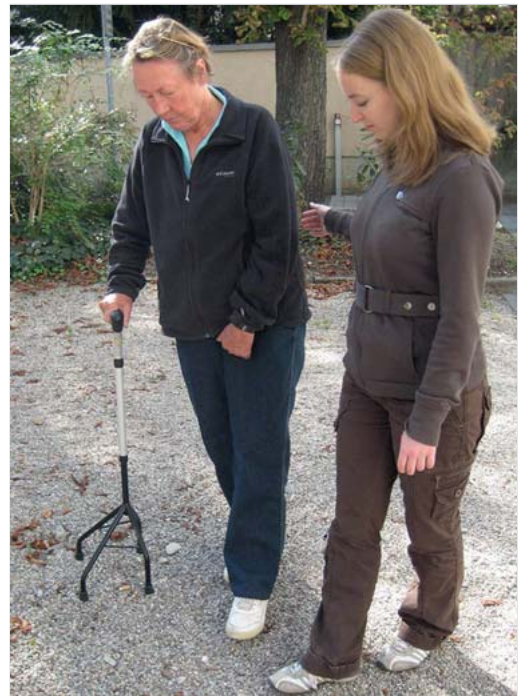
Abb. 6.8 Gehen auf Kies.

Das Konzept des zentralen Mustergenerators (CPG) geht davon aus, dass ein Netzwerk von Neuronen existiert, die intrinsisch (also ohne Anstoß von außen) rhythmisch alternierende Aktivität er-