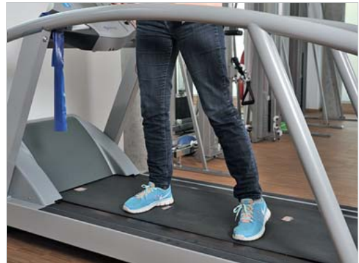
Abb. 6.17 Seitliches Gehen auf dem Laufband.