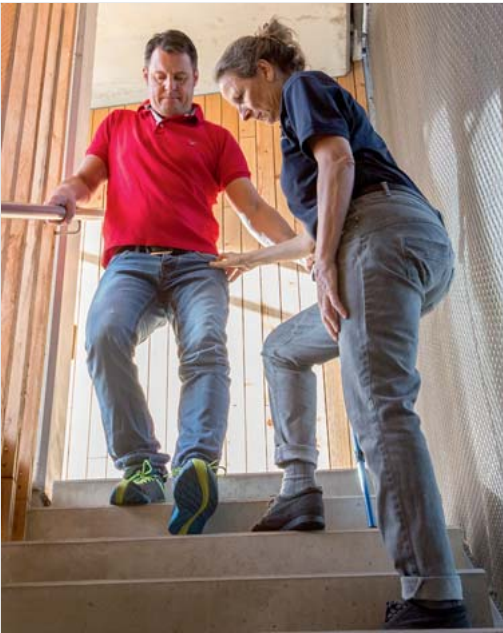
Abb. 6.9 Treppensteigen.