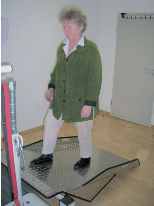
Abb. 6.5 Rampe für Lamellenlaufband.

Ist am Laufband eine Rampe fest installiert, muss diese entfernt werden, damit der Patient auch selbstständig trainieren darf. Nur wenn das Laufband in Verbindung mit bestimmten Gangtrainern