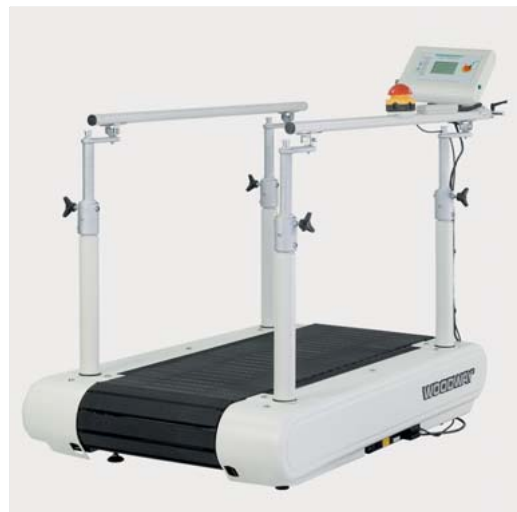
Abb. 6.4 Lamellenlaufband.

schen Rehabilitation trainiert wird, sind nicht so hoch, dass es beim Gehen zu einer Flugphase kommt. Bei Lamellenlaufbändern kann es schwierig sein, mit dem Patienten auf das Laufband zu kommen, da diese Laufbänder konstruktionsbedingt relativ hoch sind (► Abb. 6.4). Um mit