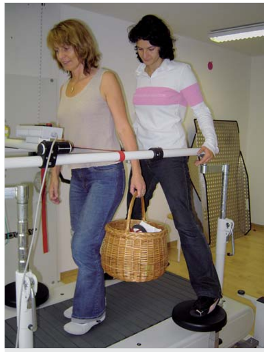
Abb. 6.19 Dual Task auf dem Laufband.

Speziell die Gehgeschwindigkeit kann auf dem Laufband sehr gut trainiert werden. Mit dem strukturierten geschwindigkeitsbasierten Laufbandtraining (Speed-dependent treadmill training, STT), das in den Jahren 1999 und 2000 in der Rehabilitationsklinik Kreitscha entwickelt und wissenschaftlich untersucht wurde (Pohl 2002; Pohl 2003) konnten Patienten nach einem Schlaganfall