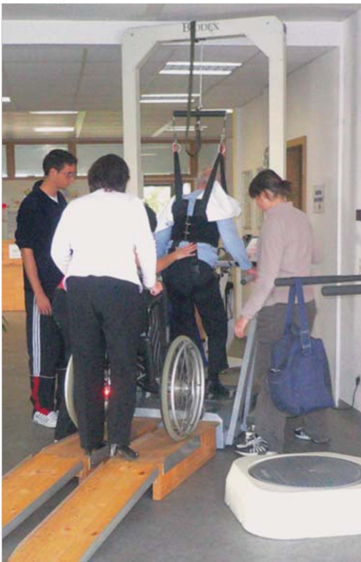
Abb. 6.2 Laufband mit Gewichtsentlastungssystem (BWS).

Ein für den Bereich der Neurorehabilitation geeignetes Laufband benötigt als wichtigste Voraussetzung eine sehr geringe Anfangsgeschwindigkeit, die nicht höher als 0,2 km/h sein darf. Viele neurologische und geriatrische Patienten tolerieren die ersten Male, wenn sie auf dem Laufband üben, keine höhere Geschwindigkeit. Die Steigerung der Geschwindigkeit sollte in 0,1-km/h-Schritten erfolgen können. Wichtig ist auch die Möglichkeit der Einstellung der Steigung (sowohl positive als auch negative Steigung). Ebenso sollte ein geeigneter, idealerweise höhenverstellbarer Handlauf vorhanden sein. Es gibt auch Laufbänder mit Handläufen, die in der Breite angepasst werden können. Die Patienten sollten sich mit dem Unterarm auf speziellen Schienen abstützen können (► Abb. 6.3).