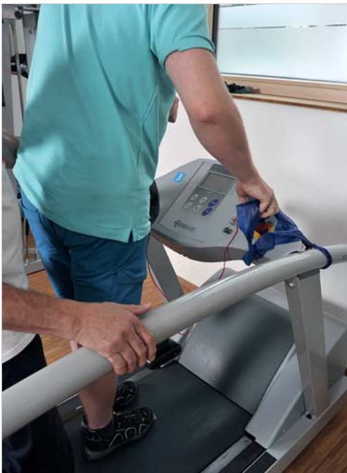
Abb. 6.18 Therabänder am Laufband.

Soll beim Laufbandtraining das Gleichgewicht trainiert werden, muss vorher getestet werden, welche Gleichgewichtsproblematik beim Patienten im Vordergrund steht. Hat der Patient mehr Probleme mit geschlossenen Augen, sollte vermehrt die Tiefensensibilität oder Propriozeption geübt werden. Dies wird mit geschlossenen Augen (Achtung: auf dem Laufband sehr schwierig!) oder mit Blickwechsel nach rechts und links, aber auch nach oben und unten geübt. Dabei muss beachtet werden, dass der Patient sich nicht festhält, da ansonsten das propriozeptive Training weniger effektiv ist bzw. die Tiefensensibilität deutlich weniger trainiert wird, da ein zusätzlicher Informationskanal zur Verfügung steht. Hat der Patient Probleme loszulassen, kann ein Theraband an den Handläufen zum Festhalten oftmals genügen, damit der Patient das Training durchführen kann (► Abb. 6.18). Das Gleichgewicht wird auf dem Laufband auch trainiert, wenn der Patient andere motorische oder kognitive Aufgaben gleichzeitig erledigen muss.