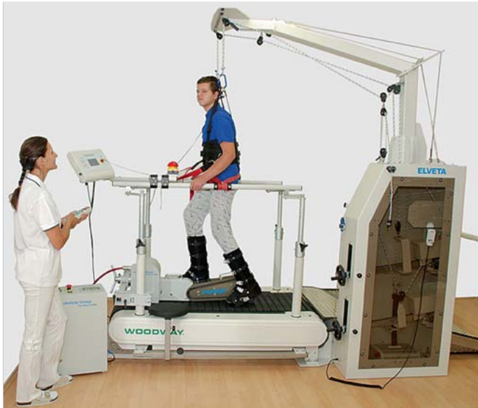
Abb. 6.7 LokoHelp „Pedago“.