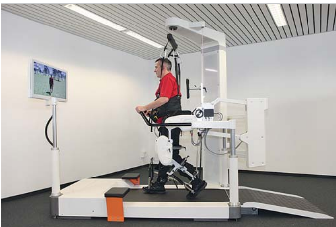
Abb. 6.6 Lokomat.

Mit Hilfe der sog. Exoskelette bzw. mit Hilfe eines Gewichtsentlastungssystems (BWS) können auch schwerstbetroffene Patienten schon in der Frühphase der Rehabilitation vom Laufbandtraining profitieren. Der Vorteil der Gangtrainer beruht u. a. darauf, dass der Therapeut körperlich entlastet wird und dadurch eine längere Trainingszeit mit einer höheren Anzahl an Repetitionen für die Patienten möglich wird.