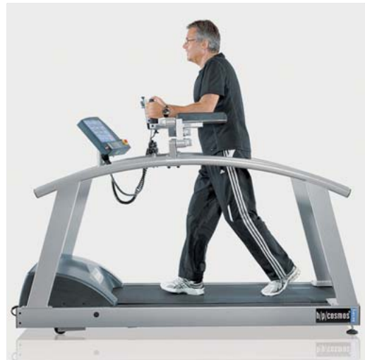
Abb. 6.3 Laufband mit Unterarmstützen.

Da in der neurologischen Rehabilitation nicht unbedingt eine gute Federung notwendig ist, muss es nicht zwingend ein Lamellenlaufband sein. Die Geschwindigkeiten, mit denen in der neurologi-