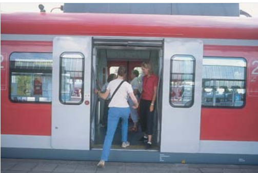
Abb. 6.10 Einsteigen in S-Bahn.

zeugen können (MacKay-Lyons 2002): Bewegungen, wie z. B. Laufen, Rennen, Fliegen, Schwimmen, Kaubewegungen, Atmung, werden durch diese neuronalen Netzwerke im ZNS erzeugt und durch sensorische Rückkopplung den Umweltefordernissen angepasst. Auch wenn Gehen eine Willkürhandlung ist, so muss es dennoch nur willkürlich in Gang gesetzt werden und läuft dann selbstständig automatisiert weiter: wir müssen nicht daran denken, wie wir gehen, da das Gehen von diesen spinalen Schaltkreisen kontrolliert wird (Dietz